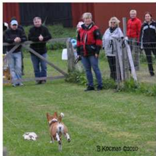
Trasan och Xtra (2a tik)