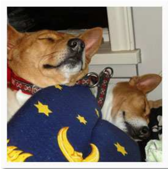
Så här trött blir man på pang

Vi var minst sagt en aning uppskruvade, så medan Missy kröp ihop i en lycklig liten hög i sängen, korkade vi upp en vinflaska. Så satt vi och filosoferade drömmande om vackra valpar ända tills vi med förfäran konstaterade att klockan hunnit bli två på natten. Förfäran eftersom vi skulle upp i ottan för att köra den långa resan hem igen. Bums i säng och lika snabbt upp ur den kändes det som. Autobahn gick smidigt med ett fåtal STAU, som inte tog timmar utan bara saktade ner farten bitvis. I Puttgarden tog vi oss tid att shoppa loss i Border shoppen som á la svenska klädjätten Ullared vräkte ut vin och sprit för löjligt låga priser.