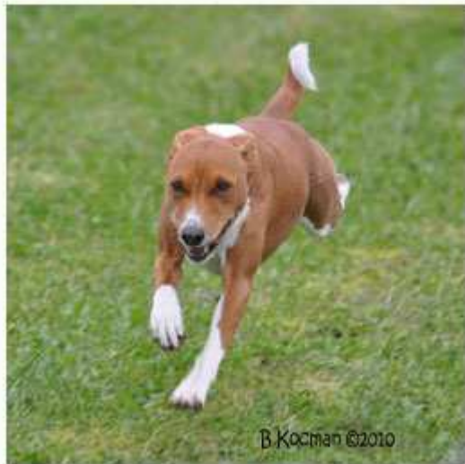
Systrarna Zelda och Daisy