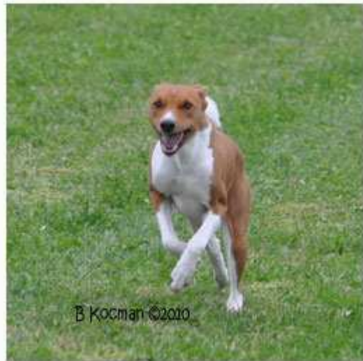
Ceasam och Laban