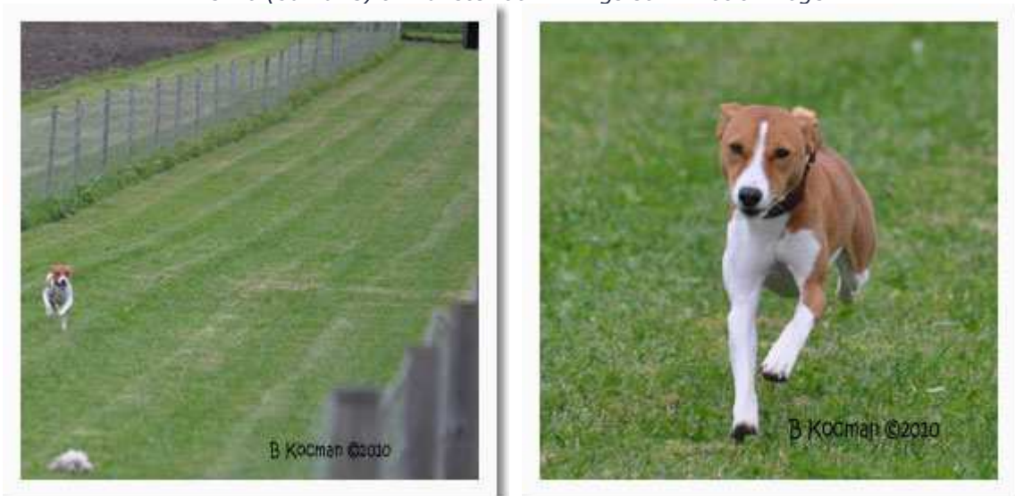
Wili (dagens snabbaste totalt och 1a hane) och Umbra (3a tik)